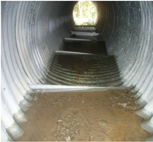
Bild 2 Schwelle am Rohrende