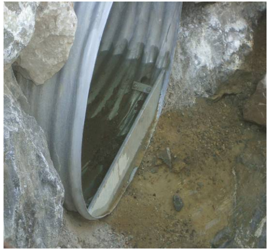
Bild 3 Holzsperre