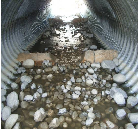
Bild 4 zugeschnittene Holzelemente