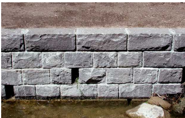
Detailaufnahme eines gemauerten Bauwerks mit behauenen Stei- nen, Nischen für Pflanzenwuchs Dorfbach, Gemeinde Buttisholz vif Mai 2002