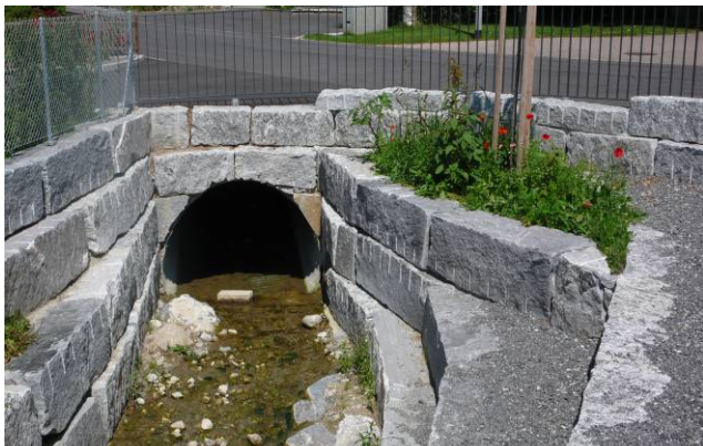
Abgestufte Ufermauer Gemeinde Rickenbach Gemeinde Rickenbach vif Sommer 2008