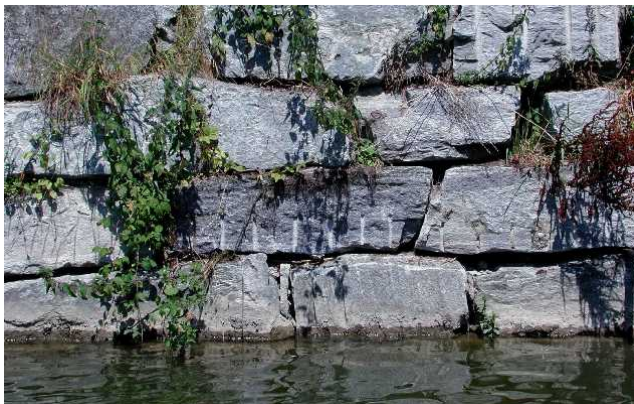
Detailaufnahme einer unvernünfteter Blocksatzmauer, Dorfbach, Gemeinde Büron vif Mai 2002