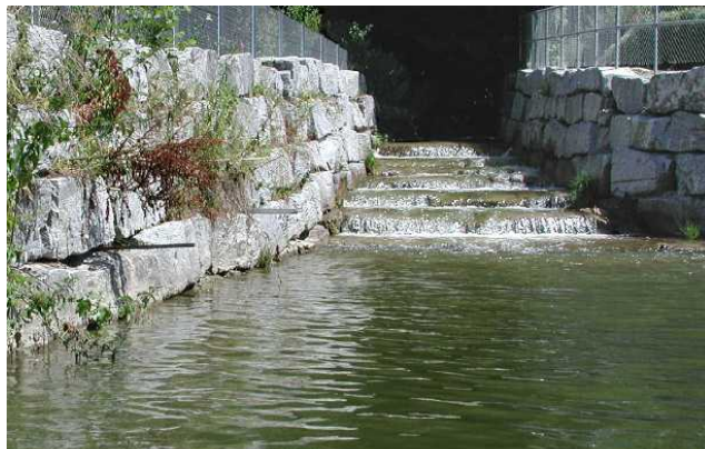
Geschiebesammler Dorfbach, Gemeinde Büron vif Mai 2002