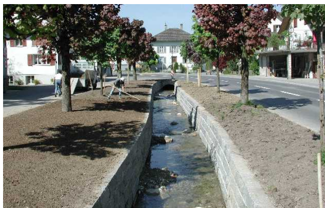
Dorfbach in der Kernzone von Buttisholz, Ortsbild von nationaler Bedeutung. Sonderfall! Dorfbach, Gemeinde Buttisholz vif Mai 2002