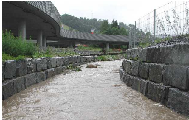
Bachausbau Autobahnausbau A2 6, Hochwasser Schlundbach, Gemeinde Kriens vif Sommer 2002