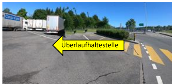
Überlauf-Haltestelle Anlage Ost