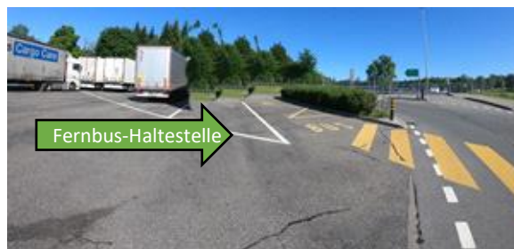
Haltestelle Anlage Ost