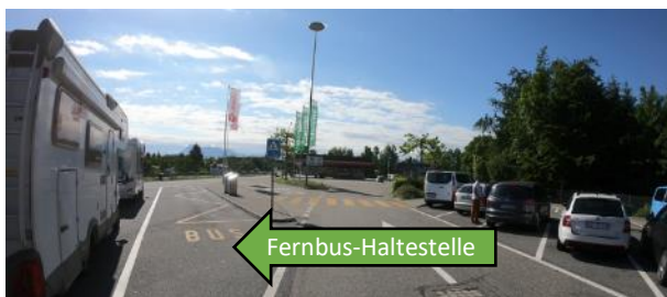
Haltestelle Anlage West