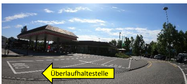
Überlauf-Haltestelle Anlage West